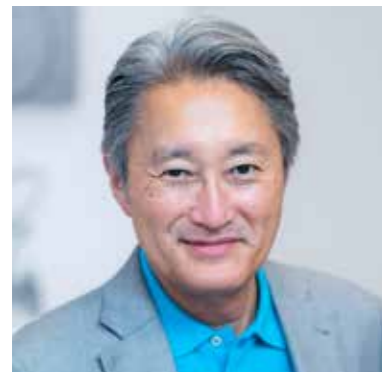
平井一夫 元ソニー株式会社 取締役会長

Kazuo Hirai Former Chairman, Sony Corporation