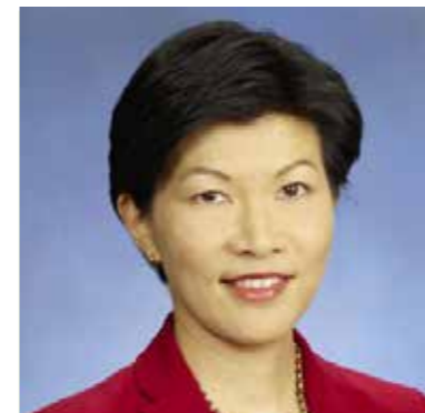
松井 キャシー ゴールドマン・サックス証券株式会社 副会長

Kathy Matsui Vice-Chair, Goldman Sachs Japan Co., Ltd.